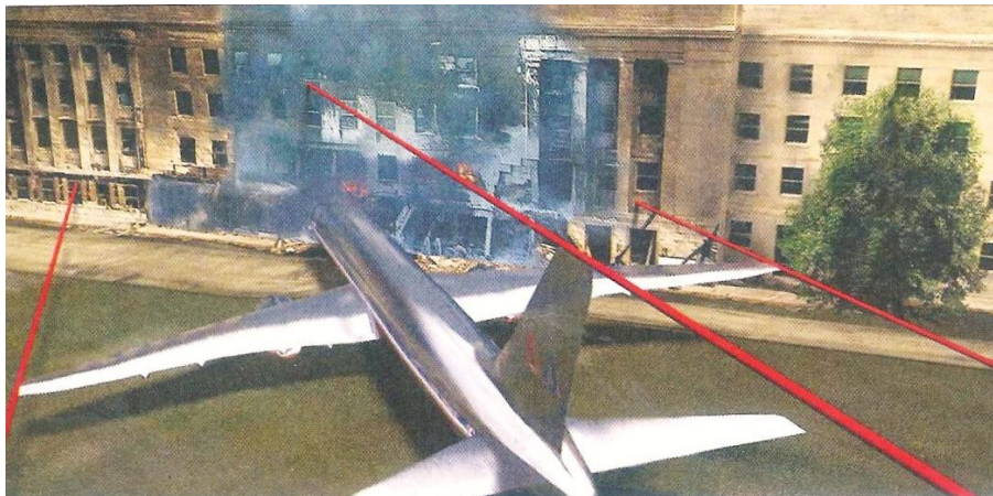
Het is goed te zien dat de inslagschade niet het gevolg zijn van deze Boeing 757

Ook hier overigens geen geelbruine kerosinebrand maar rode vlammen. Ook in Pennsylvanië valt qua inslag en geringe resten te denken aan een raket. Daarbij is het vreemd dat van drie van de vier vliegtuigen geen zwarte doos zou zijn gevonden. Ze worden altijd gevonden, ook na de hevigste branden. En van de enige wel gevonden doos (die van Pennsylvanië) zijn transcripties gemaakt die fragmentarisch zijn (waarom?) en die volgen deskundigen niet kunnen kloppen. Wat stond er