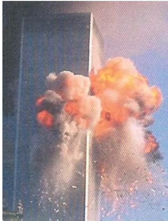
Oranje vlammen, witte rook, het gelaat van het kwaad